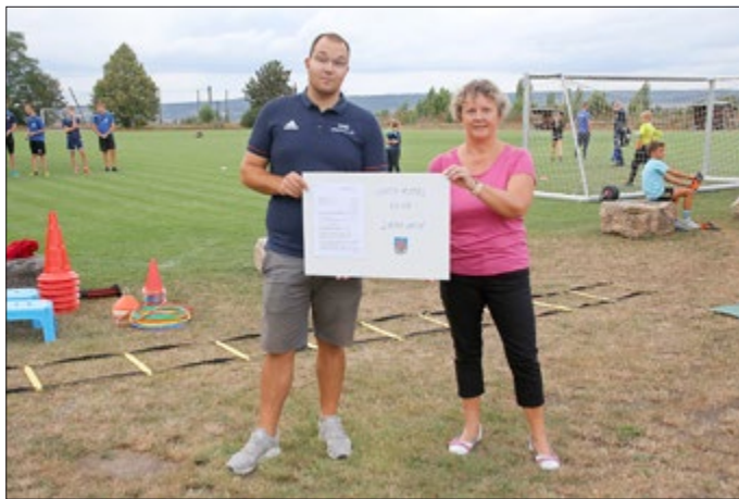
Text und Bild B. Wollweber

Der Sportverein VfB Oldisleben erhielt Lottomittel für das Jahr 2020 vom Thüringer Ministerium für Bildung, Jugend und Sport. Diese sind zweckgebunden und für die Instandhaltung des großen und schönen Sportgeländes bestimmt. Damit möchte der Verein auch weiterhin die Qualität erhalten. Der Sportverein VfB Oldisleben e.V. kümmert sich ausschließlich selbständig um die gesamte Sportanlage mit ca. 15.000 Quadratmetern. Dies ist immer wieder ein 2 schneidiges Schwert, wieviel finanzielle Mittel man dafür einsetzt, welche dann für den Zweck Sporttreiben fehlen. Von der Anlage profitieren alle Kinder und Jugendliche, welche die Thüringer Gemeinschaftsschule Oldisleben besuchen und bei regionalen Wettkämpfen, darüber hinaus. Wir sind sicher nur in gleichwertiger Kooperation funktioniert die Entwicklung. Danke an den Gemeinderat, die Schule und der Bundestagsabgeordneten Fr. Kersten Steinke.