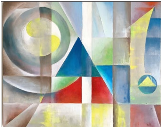
Bildurheber: Ralf Behrend „Verschränkte Geometrie“ Malerei von 2019, Öl auf Leinwand (Eine Nutzung in der Presse zur Ankündigung der Ausstellung wurde vom Bildurheber genehmigt.)

Die Ausstellung „Dreieck, Rechteck, Kreis, Quadrat - Bauhausreferenzen des Kurses Bildnerisches Gestalten“ stellt die Resultate dieser beiden Kurssemester einschließlich einiger Arbeiten des Kursleiters einer interessierten Öffentlichkeit vom 13. September bis 29. November 2020 im Schloss Allstedt vor (Eröffnung am 13. September, 15:00 Uhr).