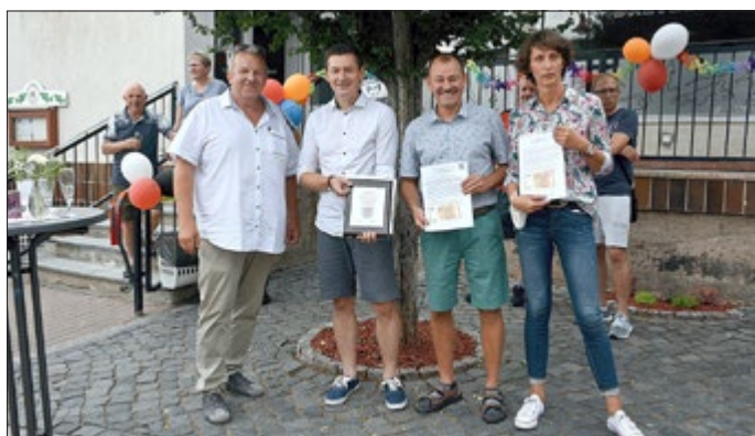
Würdigung der ehrenamtlichen Vereinsarbeit

Mit dem Bau des Rast- und Spielplatzes auf dem Vereinsgelände haben wir für alle Kinder und Besucher ein großartiges Highlight in Bretleben geschaffen. Die anhaltenden hohen Besucherzahlen bestätigen uns den Erfolg dieses Projektes. Durch die freiwillige Übernahme der Wartung und Pflege des gesamten Spielplatzgeländes wurde der Bretlebener Jugendclubverein e.V. ausgezeichnet.