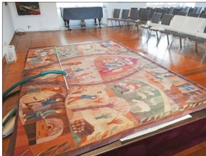
Reinigungsarbeiten am Gobelin „Aus dem bäuerlichen Leben“

Von einem plötzlichen Herzstillstand kann jeder von uns betroffen sein. Ein schnelles Handeln bereits vor Eintreffen des Rettungsdienstes, ist dann entscheidend. Viele Menschen befürchten, etwas falsch zu machen oder wissen gar nicht, was überhaupt zu tun ist. Das Falscheste ist es aber, gar nichts zu tun. Mit der Anschaffung des Automatisierten Externen Defibrillators (AED) können Todesfälle verhindert werden. Dabei handelt es sich um ein tragbares Gerät, das verwendet wird, um plötzlichen Herzstillstand zu behandeln. Es ist so konzipiert, dass es selbstständig den gesundheitlichen Zustand des Patienten analysiert und dem Anwender mitteilt, was er zu tun hat. Durch Elektroschocks kann ein normaler Herzrhythmus wiederhergestellt werden. Das verschafft dem Rettungsdienst wertvolle Zeit, um den Patienten in ein Krankenhaus zu bringen. Der AED kann von Laien ohne medizinische Ausbildung bedient werden.