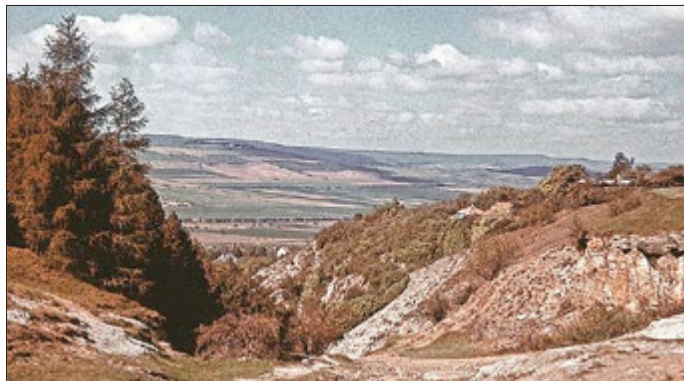
Das Wüste Kalktal, Sammlung Regionalmuseum